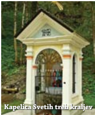
Kapelica Svetih treh kraljev

Cerkev je bila posvečena 14. 10. 1877, naslednje leto pa je bil narejen nov glavni oltar. V sredini oltarja je kip Loretske Matere Božje z Jezusom v naročju, pod njo pa angeli po morju prinašajo Marijino hišo iz Nazareta v mesto Loretto.