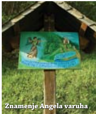
Znamenje Angela varuha

povezanih med seboj, po lesenih stebrih po bregu navzgor, navzdol pa so istočasno odvažali izkopani material. Cerkev je bila, kot večina starih zaliloških hiš, prvotno krita s skrilom .